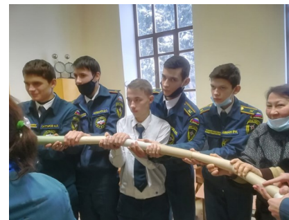
Студенческий совет колледжа